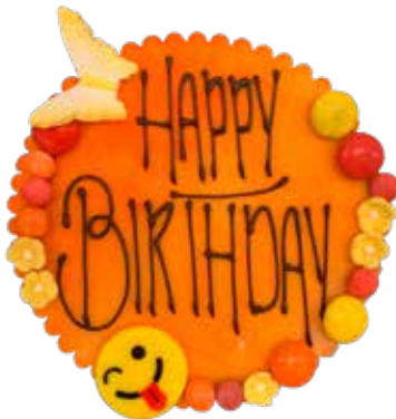
Marzipanschild MS-4 Orange, Schmetterling, 12cm Preis pro Schild Fr. 12.00