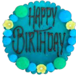
Marzipanschild MS-2 Blau, Blüemli, 8cm Preis pro Schild Fr. 8.00