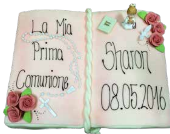
Kommunionstorte Buch 25 x 40cm | 25 Personen Preis Fr. 8.00 | p.P. + Aufwand Decor + Crazy Torten Decor Preis

SP-61 Fr. 200.00 Fr. 20.00 Fr. 20.00 Fr. 240.00