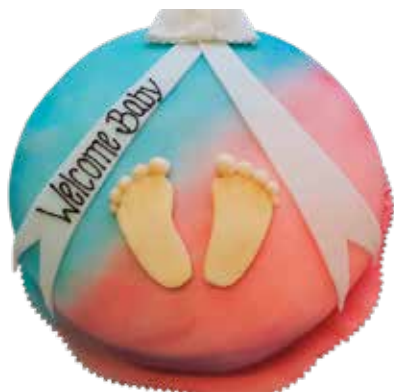
Baby Torte rund 24cm | 10 Personen Preis Fr. 8.00 | p.P. + Aufwand Decor Preis