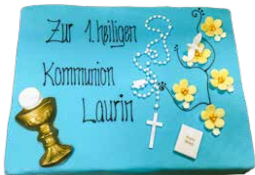
Kommunion Torte 1 25 x 40cm | 25 Personen Preis Fr. 8.00 | p.P. + Aufwand Decor + Crazytorten Sujet Preis

SP-58 Fr. 200.00 Fr. 30.00 Fr. 20.00 Fr. 250.00