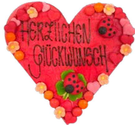
Marzipanschild Herz Rot, Kleeblatt, 12cm lang Preis pro Schild