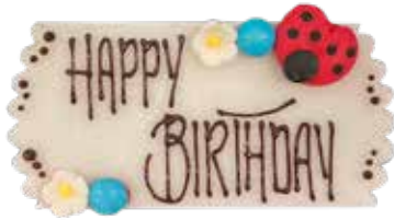
Marzipanschild rechteckig Weiss, Marienkäfer, 8cm lang Preis pro Schild