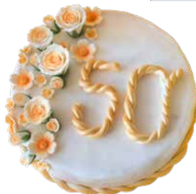
Geburtstags Torte 24 cm | 10 Personen