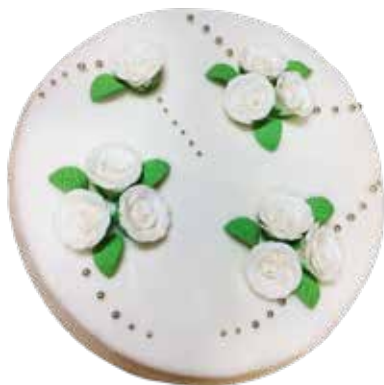
Rosen Torte 24cm | 10 Personen