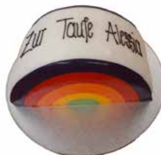
Regenbogen Torte 20 cm | 16 Personen