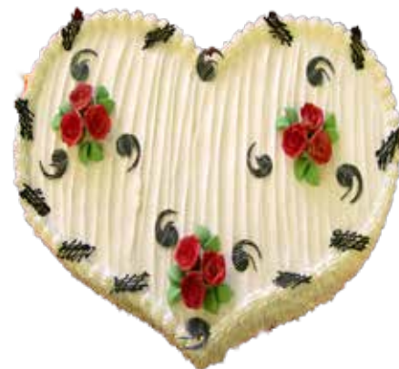
Herz Torte 60 cm | 50 Personen Preis Fr. 8.00 | p.P. Preis exkl. Blumen