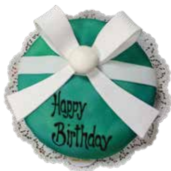
Geburtstags Torte 24 cm | 10 Personen