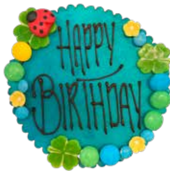
Marzipanschild MS-5 Blau, Glückskäfer, 12cm Preis pro Schild Fr. 12.00