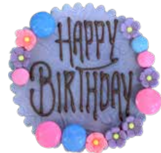
Marzipanschild MS-3 Violett, Blüemli, 8cm Preis pro Schild Fr. 8.00