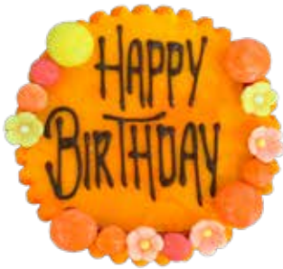
Marzipanschild MS-1 Orange, Blüemli, 8cm Preis pro Schild Fr. 8.00