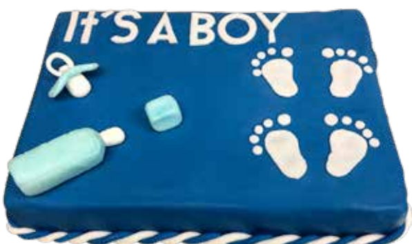
Baby Torte rechteckig 25 x 35 cm | 20 Personen Preis Fr. 8.00 | p.P. + Aufwand Decor Preis