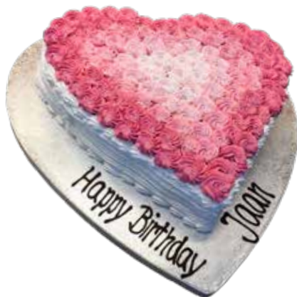
Herz Torte 40 cm | 35 Personen Preis Fr. 8.00 | p.P. + Aufwand Decor Preis