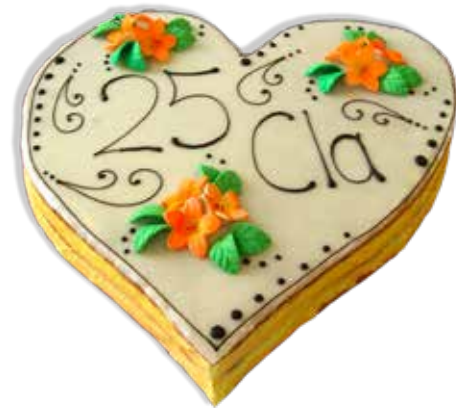
Cremeschnitten Torte 30cm | 20 Personen Preis Fr. 8.00 | p.P. Preis exkl. Blumen