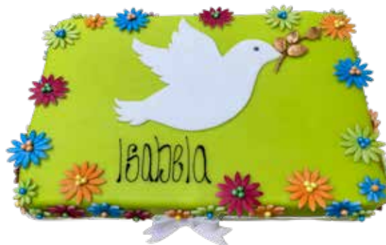
Kommunion Torte 2 25 x 35 cm | 20 Personen Preis Fr. 8.00 | p.P. + Aufwand Decor Preis

SP-58 Fr. 200.00 Fr. 30.00 Fr. 20.00 Fr. 250.00