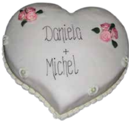
Herztorte Torte 30cm | 20 Personen Preis Fr. 8.00 | p.P. Preis exkl. Blumen