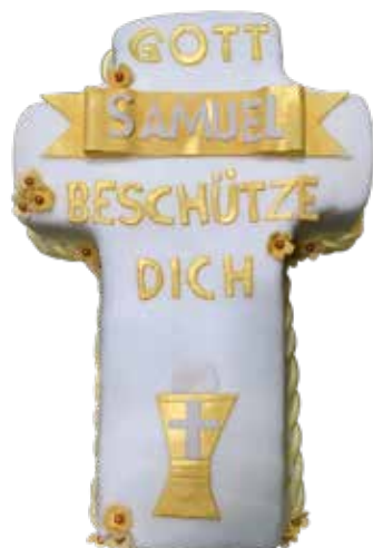
Kreuz Torte 35 cm | 25 Personen Preis Fr. 8.00 | p.P. + Aufwand Decor Preis