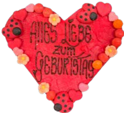
Marzipanschild Herz Rot, Marienkäfer, 8cm lang Preis pro Schild