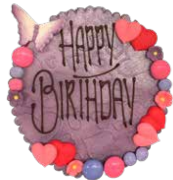
Marzipanschild MS-6 Violette, Schmetterling, 12cm Preis pro Schild Fr. 12.00