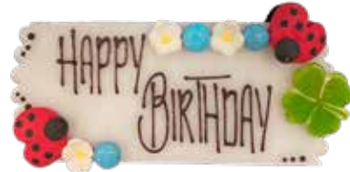
Marzipanschild rechteckig Weiss, Kleeblatt, 12cm lang Preis pro Schild